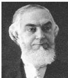
Charles-Taze Russel (1852-1916)