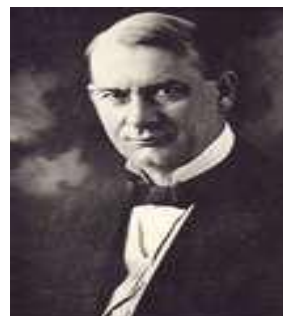
Joseph-Franklin Rutherford (1869-1942)